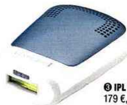
❸ IPL COMPACT, 179 €, Remington.