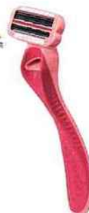
❸ INTUITION F.A.B., 12,90 €, Wilkinson.