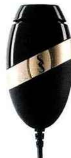
❷ BARE, 249 €, Smoothskin.