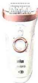
❷ SILK ÉPIL 9 SENSO SMART, 199 €, Braun.