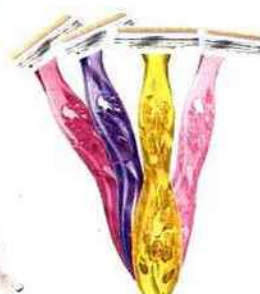
❷ PACK DE 4 RASOIRS MISS SOLEIL, 3,95 €, Bic.