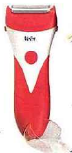
❶ SENSITIVE SHAVE, 34,90 €, Veet.