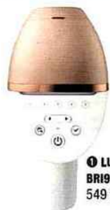
❶ LUMEA BRI956/00, 549 €, Philips.