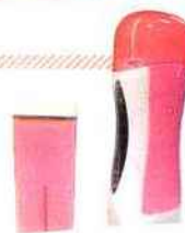
❶ KIT ÉPILATION ÉVASION DOUCEUR, 1 chauffe roll-on + 1 cartouche de cire précieuse + 50 bandes, 29 €, Esthétique Market.